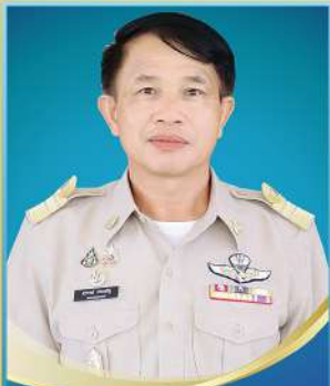
นายสุวรณ์ ประเสริฐ รองนายกเทศมนตรีเมืองลำปลายมาศ