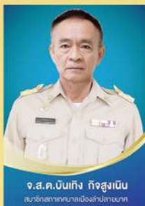
จ.ส.ด.บันเทิง กิจสูงเนิน